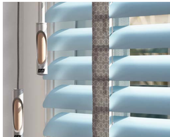
Zum gerne ansehen: Holz-Design und dekorative Leiterbänder