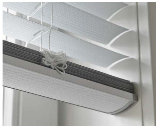
Passen perfekt: Lamellen und Unterschiene.